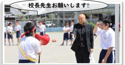
校長先生お願いします!! 生徒会種目「借り物競争」

伝統の白中ソーラン。どちらの団も一体感と躍動感に溢れる演技でした。観客審査の結果、今年は僅差で赤団が勝利しました。