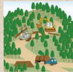
適切に森林整備を推進！