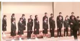
佐見中学校 全校合唱