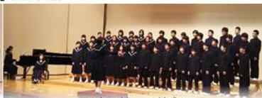
黒川中学校 全校合唱