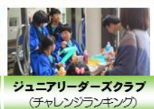
ジュニアリーダーズクラブ (チャレンジランキング)