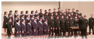
白川中学校 3年学年合唱