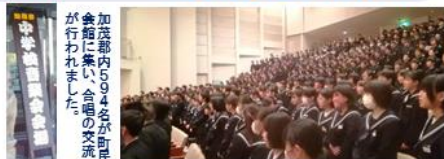
加茂郡内6,9,4名の交流が行われました。

11月7日(水)に加茂郡中学校音楽会が、11月21日(水)に白川町小学校音楽会が町民会館グロリアホールで行われました。加茂郡中学校音楽会では、加茂郡内10校が白川町民会館に集い合唱を通じて交流を深めることができました。町内の3校(白川中・黒川中・佐見中)は、他の学校と比べ、決して人数は多くはありませんが、一人一人の表現豊かに歌う一生懸命な姿から、聞く人の心に届く合唱を披露しました。