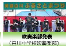
販売部発表 (白川中学校吹奏楽部)