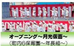
オープニング~月夜飯面~ (町内6保育園~年長組~)