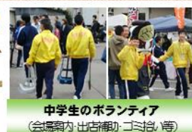
中学生のボランティア (益壽園内 出立橋小 三好小 等)