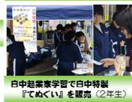
日中起業家学習で日中特製『てめくい』を販売 (2年生)

子どもたちはこの祭りを楽しみにしています。2日からの文化展の入場者数は延べ3259人。その中で、活躍する子どもたちがいました。もちろんステージの上で活躍する子どももいれば、祭りを陰で支え活躍する子どももいます。幼児を楽しませようと、幼児目線で優しい声をかけ、必死に楽しませようとするジュニアリーダーズの中学生。人混みをかき分けゴミを拾うボランティアの中学生。そんな姿を見ていると、温かな気持ちになるとともに、この子たちが『この白川町を将来支えてくれると嬉しいな!』と願いを込めたくまりました。