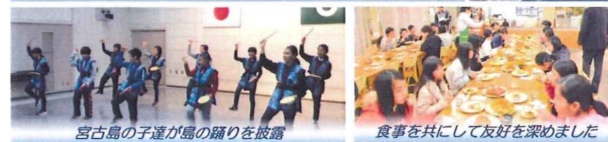
宮古島の子ども達が島の踊りを披露