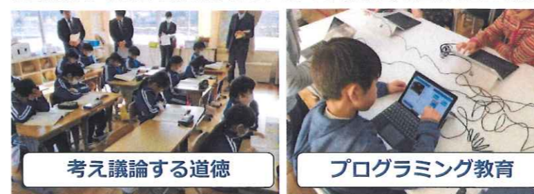
考え議論する道徳

平成29年3月31日に小学校・中学校学習指導要領が公示されました。小学校は32年度・中学校は33年度4月から完全実施となります。この改訂の背景には、グローバル化の進展や技術革新等により、社会構造や雇用環境が大きく、また急速に変化しており、予測が困難な時代を迎えようとしています。そんな時代の中で、子どもたちが、様々な変化に積極的に向き合い、他者と協働して課題を解決したり、様々な情報を見極め知識の概念的(大まかに捉える)な理解ができる子どもを目指す教育改革です。