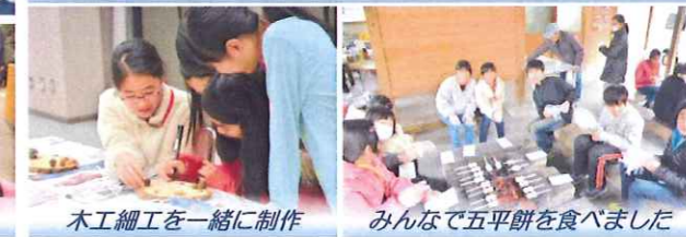
木工細工を一緒に制作