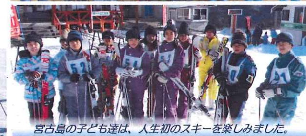
宮古島の子ども達は、人生初のスキーを楽しみました。