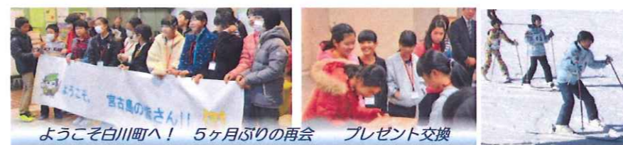
ようこそ白川町へ！ 5ヶ月ぶりの再会 プレゼント交換