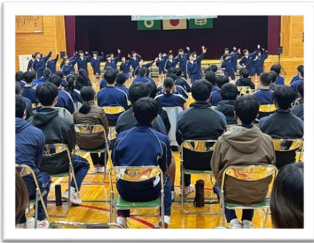
↑白中2年生のダンス発表を見ている黒中生

ロリアホール)で合唱を披露しあったりしましたが、「それだけのつながりにしたくない」という両校の生徒の思いから実現をしたものです。子どもたちは、大人では考えつかないことを、自分たちで考え、新しいものを創り出そうとしています。教育委員会としてもこの営みをバックアップしていきます!!