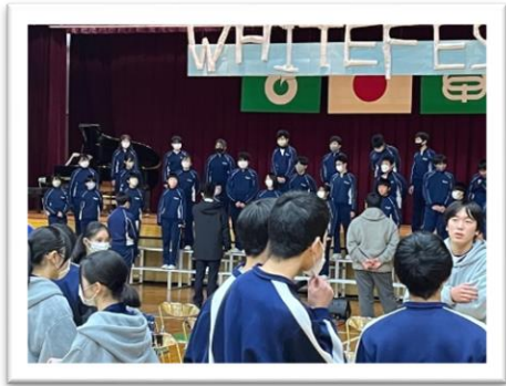
↑白中との合唱交流のために休憩時間に練習をする黒中生

黒川とは大分やり方が違って、見ているだけでも面白かったし、全校で明るく楽しく文化祭をつくろうとしている姿がすごいと思いました。他の学校の文化祭に参加することはあまりないことなので、とてもよい機会にすることができてよかったです。