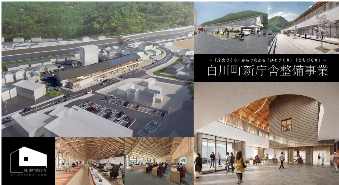
白川町新庁舎の完成イメージ